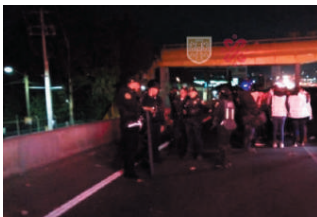
200 elementos de la SSC acompañan a la caravana migrante.

Con gritos de “ayúdenos”, “déjenos pasar”, las mujeres migrantes claman por apoyo.