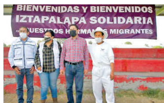
Habrá un puesto de mando de la CNDH de la CDMX Especial

Batres comentó que para los poco menos de 400 migrantes se instaló una carpa para que pernocten hombres, mujeres y niños, también un comedor,