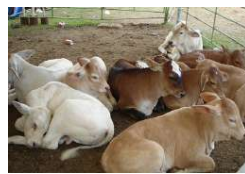
Nueva raza, llamada popularmente "todo terreno"

El pasado fin de semana, la Secretaría de Agricultura y Desarrollo Rural, a través de la Coordinación General de Gana-