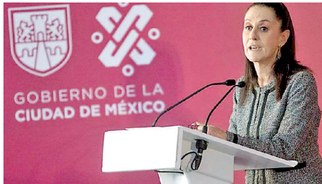
Hasta ahora, se han contabilizado 2 millones 400 mil visitantes Especial

DESDE EL C5 , la mandataria capitalina supervisó el operativo “Bienvenido peregrino 2021”