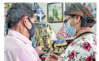
El giro de alimentos preparados es el más beneficiado por estas fiestas Especial

Explicó que entre los principales giros beneficiados por las fiestas guadalupanas están los negocios de venta de alimentos preparados, artículos religiosos, hoteles, florerías y misceláneas. ●