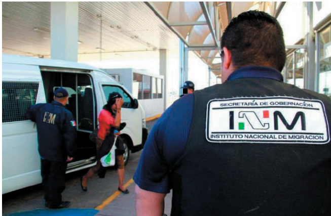
A bordo del transporte iban 9 salvadoreños, un hondureño y un nicaragüense. Especial

La camioneta del INM con 11 personas migrantes provenientes de El Sal-